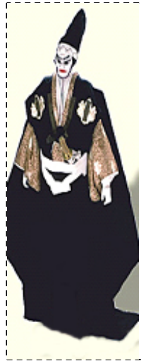
Marionnette à tringle

La marionnette est actionnée par le haut à l'aide de fils.