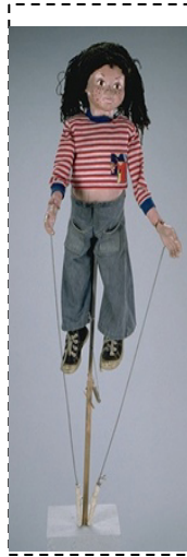
Marionnette à tige

La marionnette est actionnée par le haut à l'aide de fils.